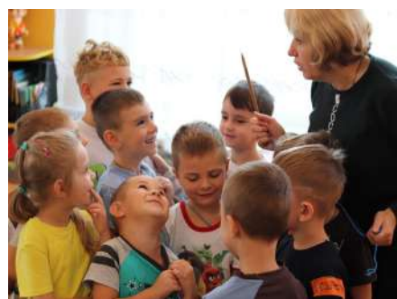
Фото закладу дошкільної освіти №84 "Вільна й цікава в нас взаємодія, ми кожному дню у